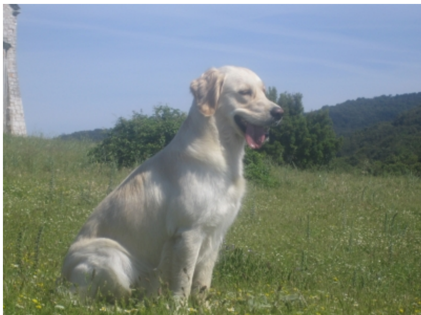
Branwyn Alkimoennis of Graceful