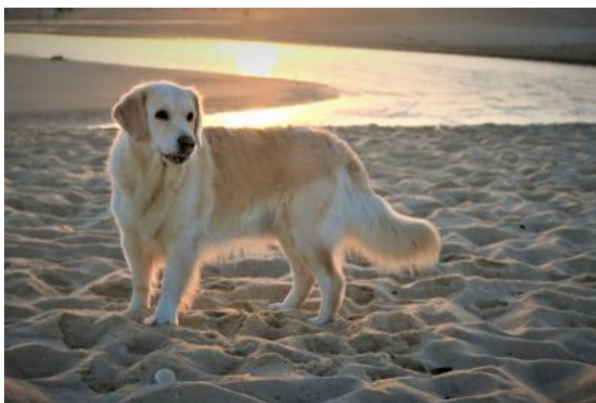
Alkimoennis Härliga Mossan

Leider starb Branwyn im März 2019 14 Tage vor dem erwarteten Wurf. Aus dieser Paarung behielten wir unsere Mossan. Sie entwickelte sich zu einer wunderschönen und arbeitsfreudigen Hündin an der wir viel Spaß haben. Auch sie hat die jagdlichen Prüfungen schon bestanden und einen wunderschönen Formwert erhalten.